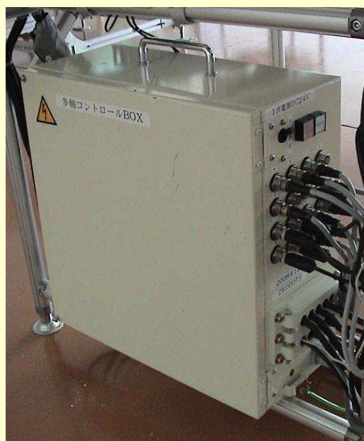
リフター、プッシャー、ハンガートラバーサ等で2~4軸装置までの専用制御ユニット(コントロールボックス)です。 ※上図は4軸ユニット