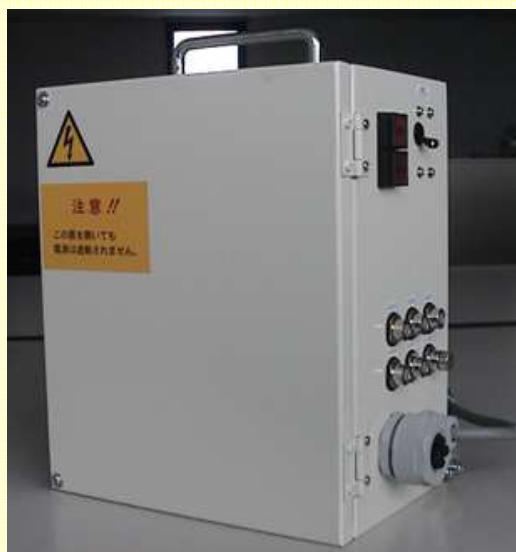
リフター、シフト等に使う1軸装置専用の制御ユニット(コントロールボックス)です。