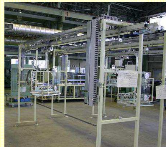
標準的な箱物搬送の使用例(HT12A・回転タイプ)