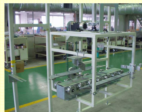
駆動コンベア(オプション)